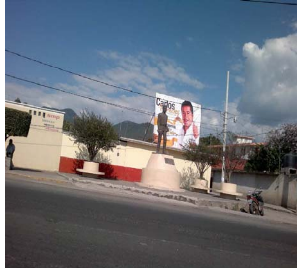
Ubicación: Morelos casi esq. Nicolás Bravo en la plaza al lado del Centro Materno Infantil Nueva Vida.