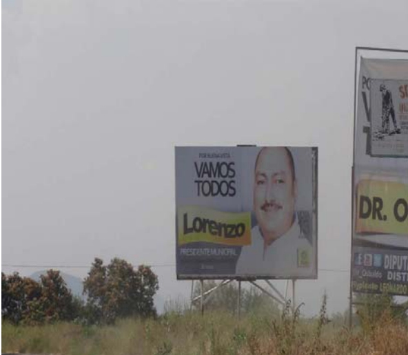
Ubicación: Carretera Tepalcatepec-Apatzingán a 244 km. en la salida a La Ruana (Felipe Carrillo Puerto) (Norte a Sur).