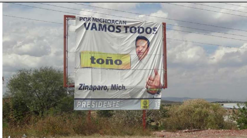
Ubicación: Carretera Purépero de Echaiz-La piedad km. 25.5 en el entronque de entrada a Zináparo.