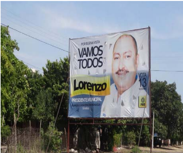
Ubicación: Carretera Tepalcatepec-Apatzingán a 248 km. Poblado 18 de Marzo (Poniente a Oriente). (Lona).