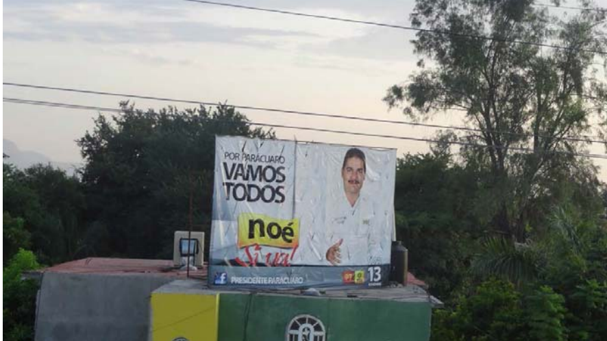
Ubicación: Carretera nacional entrada a la población de Uspero.