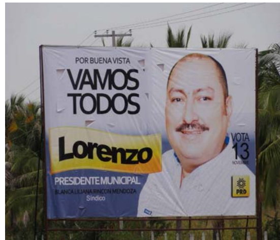
Ubicación: Carretera Tepalcatepec - Apatzingán km 228. (Sur a Norte) Santa Ana Amatlán Santa Ana Amatlán. (Lona).