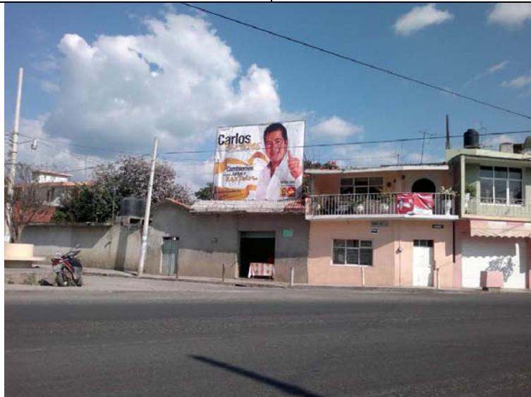
Ubicación: Morelos casi esq. Nicolás Bravo al lado del XII0091.