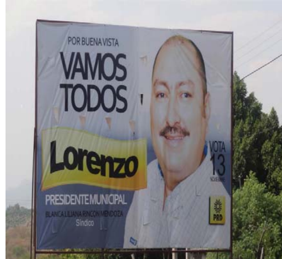
Ubicación: Carretera Tepalcatepec-Apatzingán a 248 km. Poblado 18 de Marzo (Oriente a Poniente). (Anuncio Espectacular).