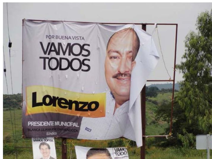
Ubicación: Carretera Peribán-Buena Vista en el poblado el carrizalillo entronque al pilón.