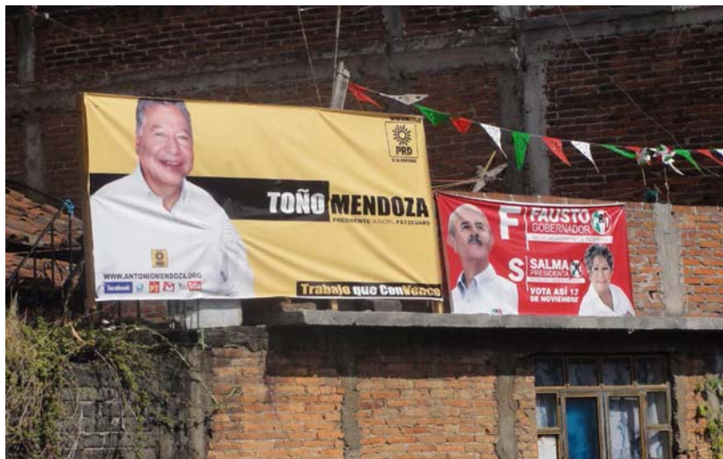
Ubicación: Pátzcuaro calle Ahumada No.74