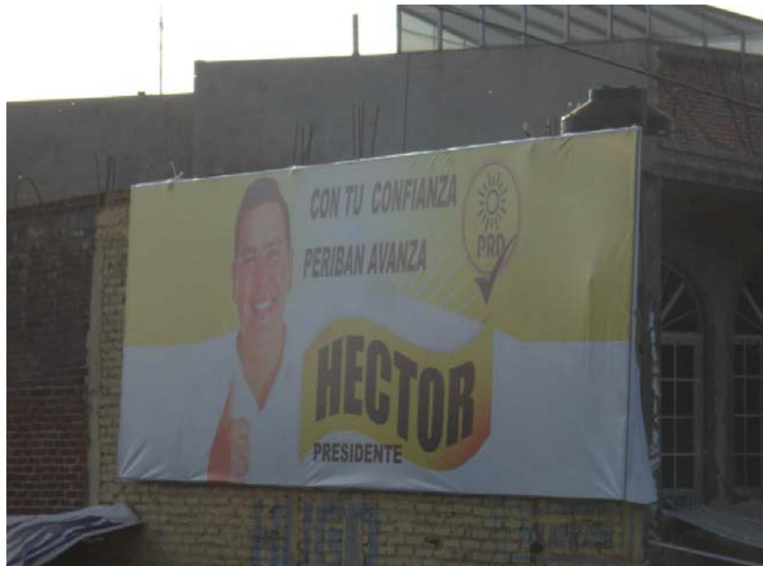
Ubicación: Carretera Peribán - Los Reyes Km. 2