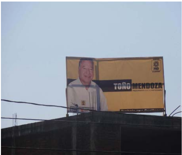
Ubicación: Libramiento Ignacio Zaragoza, Colonia Centro