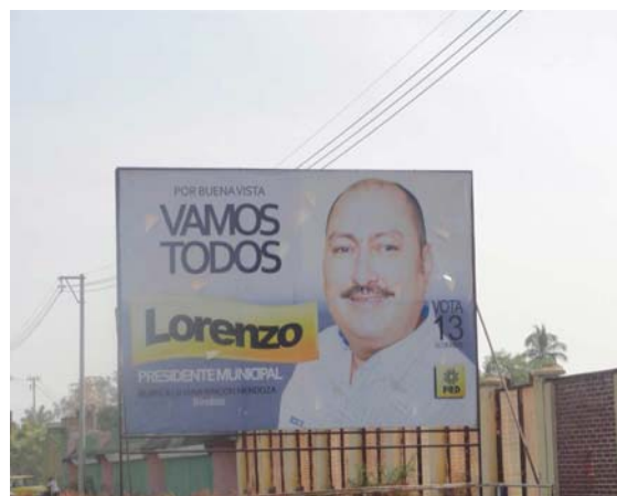
Ubicación: Carretera Federal Apatzingán - aguililla km 20 poblado Pizándaro (a un lado de subestación de CF), (Poniente a Oriente). (Lona).