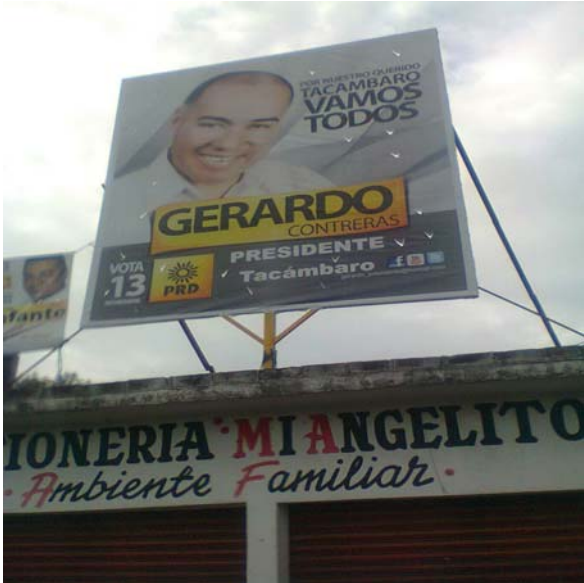
Ubicación: Libramiento sur_s/n_altura_Super_Servicio_Gasolinero_Del_Sur (Torteria Mi Angelito).