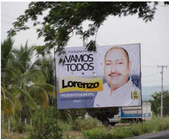
Ubicación: Carretera Tepalcatepec - Apatzingán km 228. (Norte a Sur). (Anuncio Espectacular).