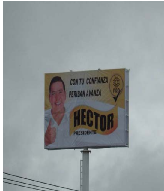
Ubicación: Peribán-Los Reyes Km. 1.3 ATRÁS (Oriente a Poniente). (Lona)