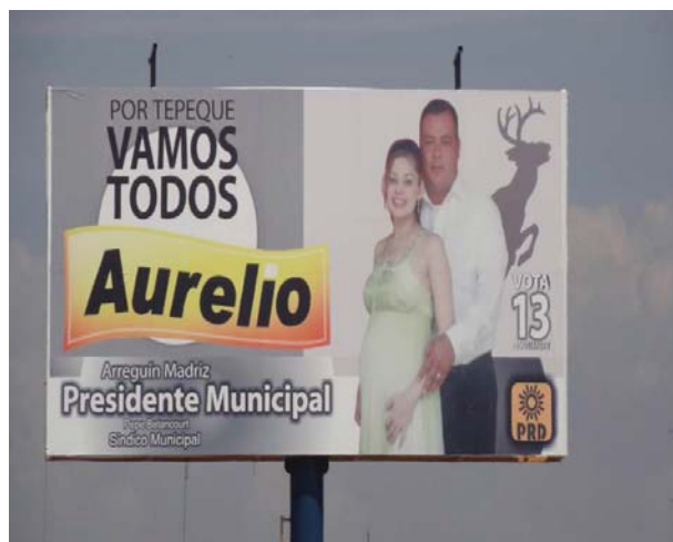
Ubicación: Carretera Tepalcatepec-Apatzingán a 262 en el puente los otates junto a la gasolinera (Sur a Norte)