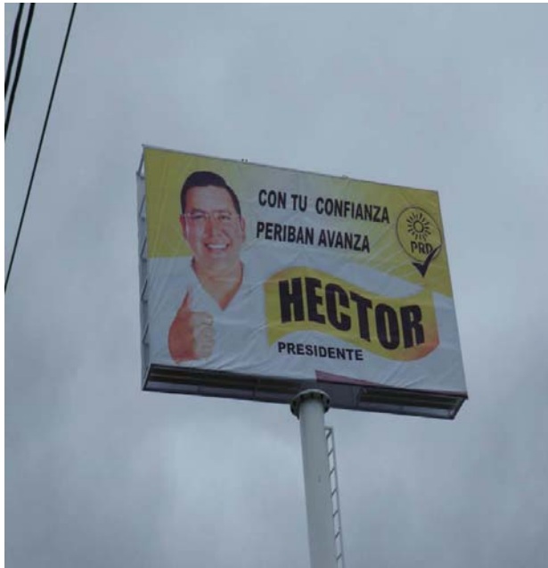
Ubicación: Los Reyes-Peribán Km. 1.3 FRENTE (Poniente a Oriente). (Anuncio Espectacular)