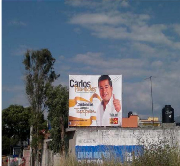
Ubicación: Carretera Zitácuaro Cd Hidalgo entrando al poblado Malacate, enfrente del XII0018