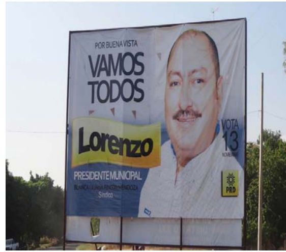
Ubicación: Carretera Tepalcatepec-Apatzingán km. 223 junto a servicio la moreliana 200mts del panteón municipal (Oriente a Poniente).