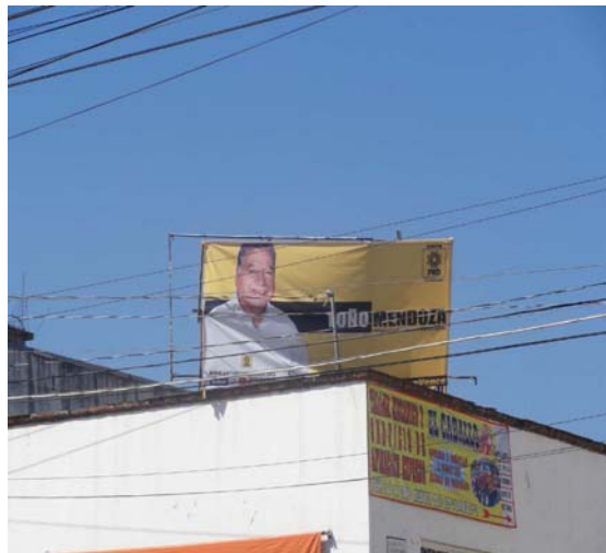
Ubicación: Galileo Galilei con Libramiento Ignacio Zaragoza No 52.