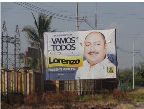
Ubicación: Carretera Federal Apatzingán -aguililla km 20 poblado Pizándaro (a un lado de subestación de CF) (Oriente a Poniente). (Anuncio Espectacular)